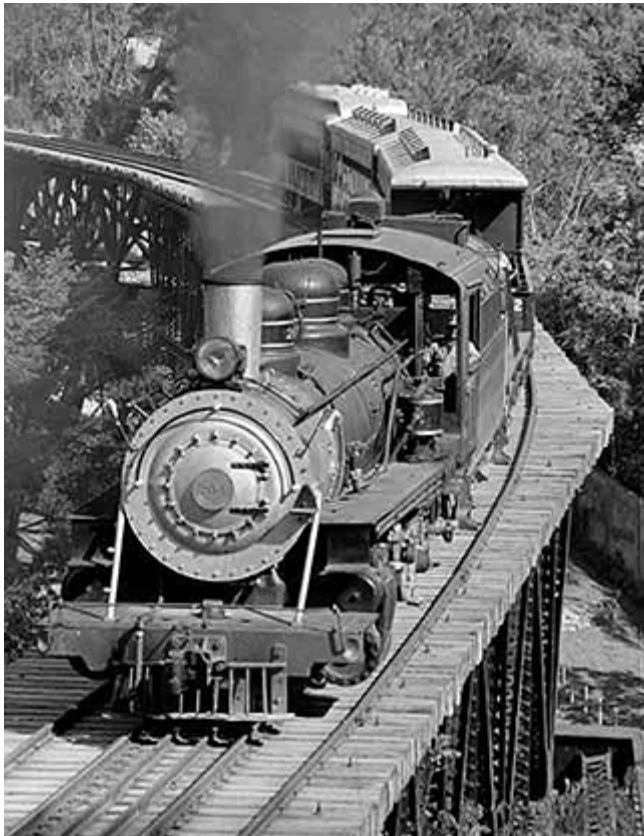
> At Aguas Calientes (milepost 176.09), the Fifth Anniversary steam powered special train rolls across the large 100 foot high bridge.

En la localidad de Aguas Calientes (kilómetro 281), el tren a vapor con el cual se celebró el quinto aniversario de la reapertura del ferrocarril cruza uno de los tantos espectaculares de la línea. En este caso el puente tiene 30 metros de altura.